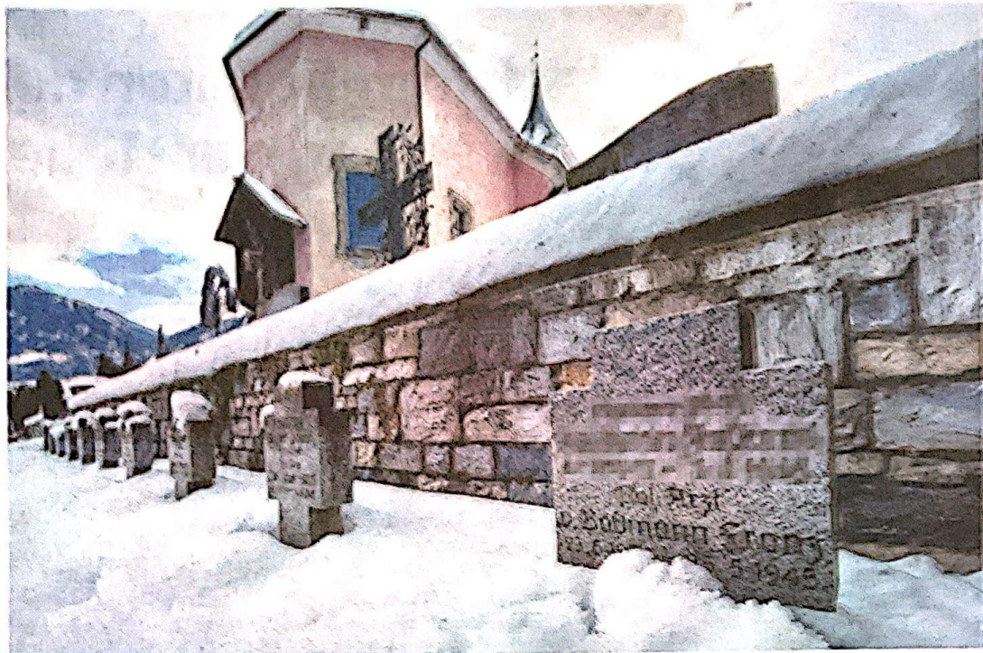
Bodmanns Grab auf dem Lender Friedhof. Den anderen Soldaten, die dort liegen, konnte man keine Kriegsverbrechen nachweisen.

Der 1909 im baden-württembergischen Zwiefaltendorf geborene SS-Obersturmführer war